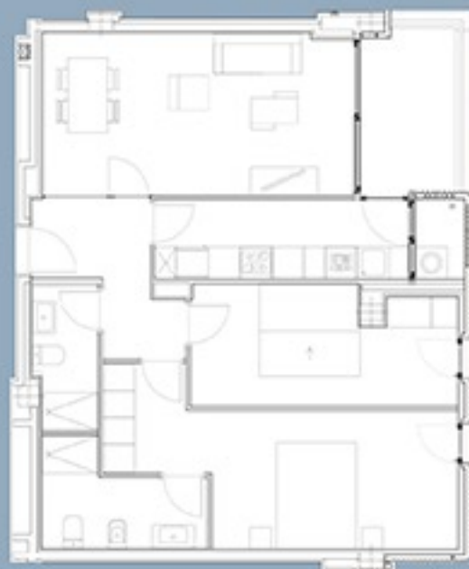
Piso 2 dormitorios tipo E